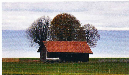
Voilà comment se présentait l'ancien stand avant sa démolition (en bas).